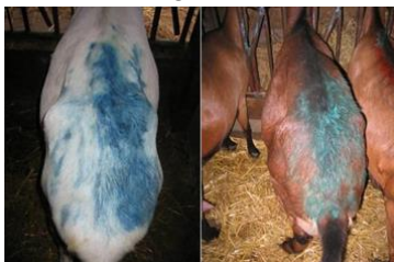
Fig. 1. Capre ben marcate

Tappa 2: rilevamento dei calori. Quando l'effetto becco viene applicato prima dell'inseminazione, è necessario rilevare il calore delle femmine al fine di determinare con precisione il momento dell'IA. I grembiuli hanno un spazio in cui posizionare un pastello marcatore. Cinque giorni dopo l'introduzione dei maschi (per evitare i cicli corti), il marcatore viene posizionato sul grembiule per rilevare il calore, e le capre in contatto diretto con il becco saranno considerate in calore e quindi inseminate se nettamente ed estesamente marcate su tutta la groppa (Fig. 1), viceversa è bene non inseminare le capre insufficientemente marcate (Fig. 2). La "buona" marcatura presuppone l'immobilizzazione della capra e l'accettazione della monta da parte del becco, segni caratteristici del calore. Il rilevamento della marcatura viene eseguito una o due volte al giorno, ad esempio al momento della mungitura.