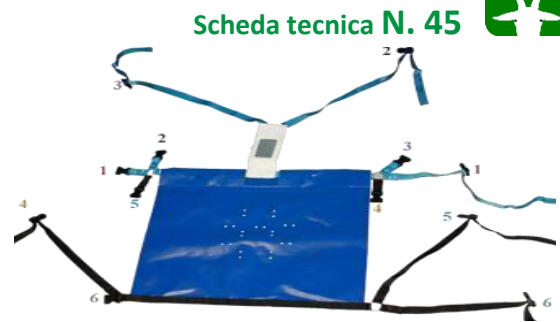
Fig. 2. Grembiule INRA a 6 cinghie, per la vestizione allacciarle nell'ordine numerico indicato (1 garrese, 2-3 spalle, 4-5 schiena, 6 groppa)

Per quanto riguarda la scelta delle femmine si rimanda alla scheda tecnica "La scelta delle capre e l'organizzazione del cantiere di IA).