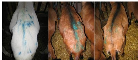
Fig. 2. Capre non sufficientemente marcate

Tappa 3: inseminazione o monta. L'inseminazione o la monta sono realizzate dalle 12 alle 24 ore dopo l'osservazione dei calori. Questo protocollo necessita una disponibilità dell'inseminatore per un periodo di 3-5 giorni. Oltre i 10 giorni di rilevazione, le femmine non ancora venute in calore non rispondono più all'effetto becco; il protocollo viene quindi interrotto e le IA concluse (vedi scheda "L'inseminazione senza ormoni").