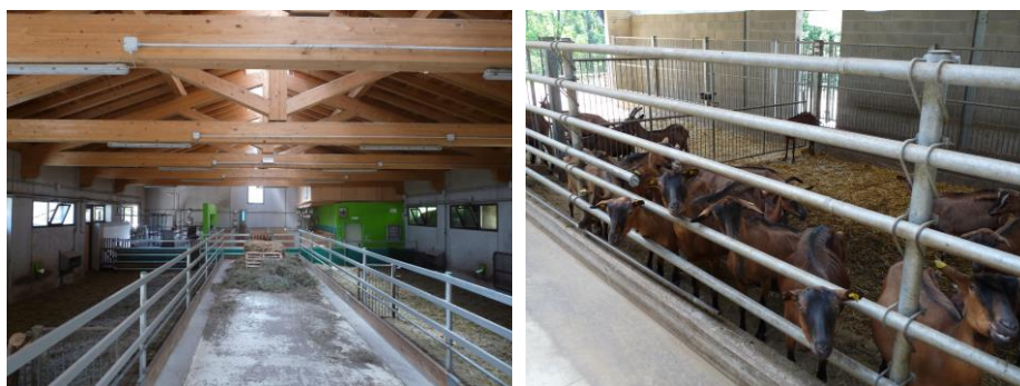
Fig. 4. Esempi di staccionate con tubi metallici

Le staccionate di tubi metallici sono invece dei sistemi di contenimento degli animali nei box più semplici ed economiche rispetto alle catture, costituite da tubi metallici giuntati tra loro ad altezze variabili a seconda degli animali allevati (razza e categoria) e dell'altezza della lettiera. Queste attrezzature non consentono il contenimento dei singoli animali, ma semplicemente separano il box dalla corsia di alimentazione lungo la linea del fronte di alimentazione. Importante: in assenza di catture, per evitare eccessiva competizione in fase alimentare, prevedere un fronte mangiatoia per capra adulta pari a 50 cm.