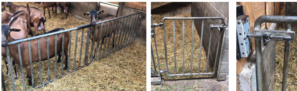
Fig. 1. Esempi di sistema di chiusura dei cancelli non manipolabili dalle capre

Requisito fondamentale dei cancelli divisori e di quelli di accesso ai box è inoltre il sistema di chiusura, che non deve essere manipolabile dalle capre (spesso si utilizzano dei normali chiavistelli bloccati con dei moschettoni).