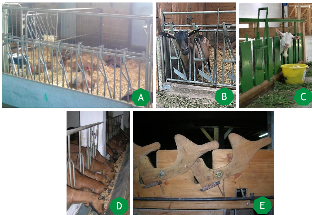
Fig. 3. Esempi di catture acquistate (A, B e C catture singole in metallo), adattate da stalla di bovini (D) e autoconstruite in legno (E)

Le staccionate di tubi metallici sono invece dei sistemi di contenimento degli animali nei box più semplici ed economiche rispetto alle catture, costituite da tubi metallici giuntati tra loro ad altezze variabili a seconda degli animali allevati (razza e categoria) e dell'altezza della lettiera. Queste attrezzature non consentono il contenimento dei singoli animali, ma semplicemente separano il box dalla corsia di alimentazione lungo la linea del fronte di alimentazione. Importante: in assenza di catture, per evitare eccessiva competizione in fase alimentare, prevedere un fronte mangiatoia per capra adulta pari a 50 cm.